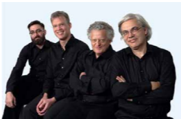
アルディッティ弦楽四重奏団