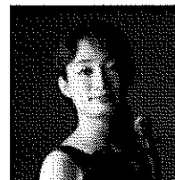
毛利文香(ヴァイオリン)