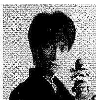
山根一仁(ヴァイオリン)