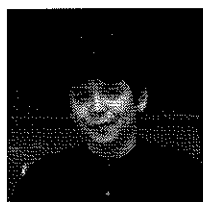
細川俊夫 (音楽監督)